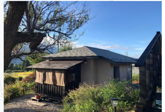
かつらの丘ジビエ工房