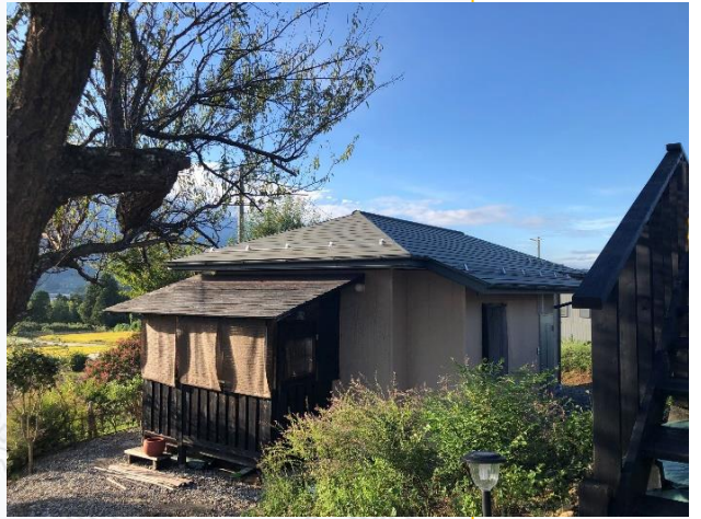
かつらの丘ジビエ工房